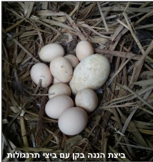
ביצת הננה בקן עם ביצי תרנגולות